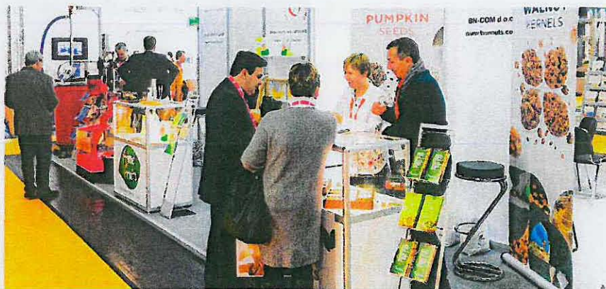
Die Newcomer der Branche stellen auf der ProSweets gemeinsam aus.

SÜSSWARENZULIEFERER TREFFEN SICH ANFANG FEBRUAR IN KÖLN